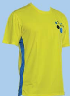
Funktionsshirt gelb € 25,-