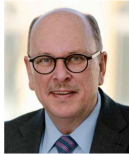
شتيفان غروتر وزير الشؤون الإجتماعية و الإندماج بولاية هيسن