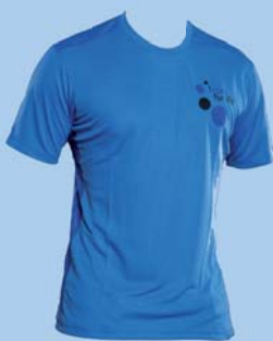
Funktionsshirt blau € 25,-