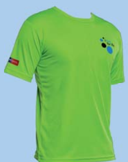
Funktionsshirt grün € 25,-

„I run for life“ und der dazugehörige DeutschlandCup sind langfristige Projekte der PalliativStiftung.