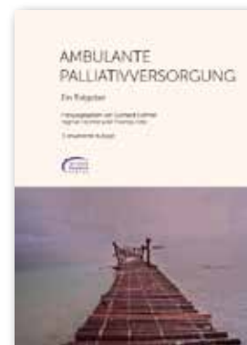
Ambulante Palliativversorgung 283 Seiten 10,- €

Alle Preise sind Brutto-Einzelpreise. Die Mitglieder unseres Fördervereins erhalten alle Materialien versandkostenfrei. Gerne können wir auch über Rabatte beim Kauf größerer Mengen reden.