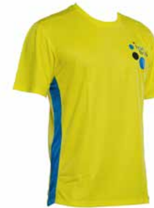
Funktionsshirt gelb € 37,-