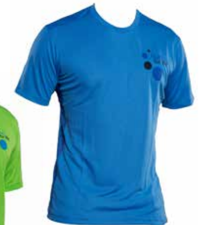
Funktionsshirt blau € 37,-