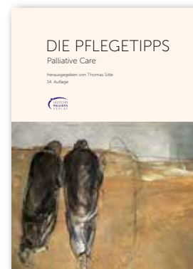
Die Pflgetipps – Palliative Care 85 Seiten kostenfrei