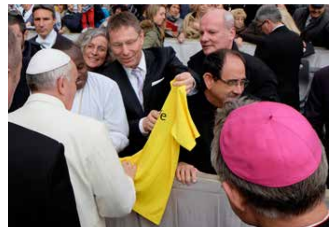
Im Februar 2014 hatten wir die große Ehre einer Audienz bei Papst Franziskus und durften ihm unser „I run for life“-Shirt überreichen.