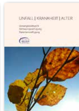
Unfall-Krankheit-Alter (Patientenverfügung) kostenlos solange Vorrat reicht