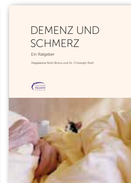
Demenz und Schmerz 70 Seiten 5,- €