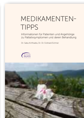
Die Medikamenten-tipps – Ein Ratgeber 204 Seiten 10,- €