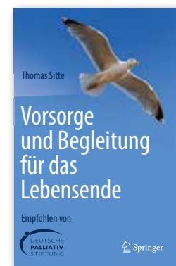
Vorsorge und Begleitung für das Lebensende ca. 200 Seiten 19,99 €

Dieses Buch wurde von Praktikern der hospizlich-palliativen Arbeit für Praktiker geschrieben. Es orientiert sich am Katalog des relevanten Prüfungsinhaltes für die „Zusatzbezeichnung Palliativmedizin“, hat dabei aber trotzdem immer einen echten Bezug zur täglichen Arbeit. Dabei lebt es trotz vieler, sonst trockener Fakten von einer Fülle relevanter Fallbeispiele.