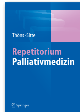
Repetitorium Palliativmedizin 322 Seiten 39,99 €

Dieses Buch wurde von Praktikern der hospizlich-palliativen Arbeit für Praktiker geschrieben. Es orientiert sich am Katalog des relevanten Prüfungsinhaltes für die „Zusatzbezeichnung Palliativmedizin“, hat dabei aber trotzdem immer einen echten Bezug zur täglichen Arbeit. Dabei lebt es trotz vieler, sonst trockener Fakten von einer Fülle relevanter Fallbeispiele.