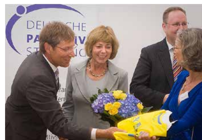
Beim Empfang der PalliativStiftung in Berlin war als besonderer Gast Frau Daniela Schadt, die Lebensgefährtin des Bundespräsidenten, als interessierte und sehr gut zum Thema informierte Gesprächspartnerin anwesend.