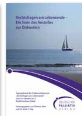
Rechtsfragen am Lebensende 72 Seiten 5,- €