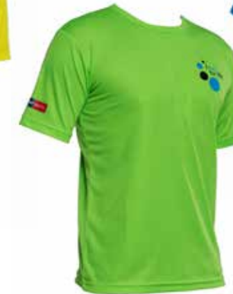
Funktionsshirt grün € 27,-