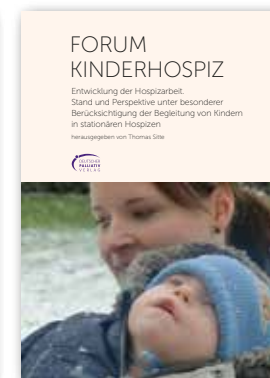
Forum Kinderhospiz 104 Seiten 10,- €