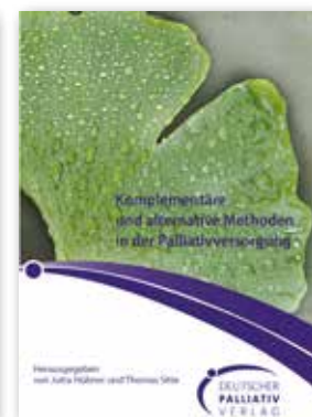
Komplementäre und Alternative Methoden in der Palliativversorgung 112 Seiten 5,- €